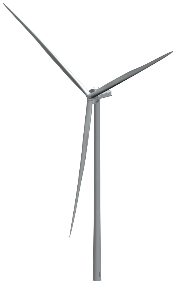
Abb. 1: Produktübersicht

Die Windenergieanlage erzeugt elektrische Energie aus Wind. Der anströmende Wind bewirkt, dass der Rotor sich im Uhrzeigersinn dreht. Die Drehbewegung wird in elektrische Energie umgewandelt. Die Windenergieanlage arbeitet automatisch.